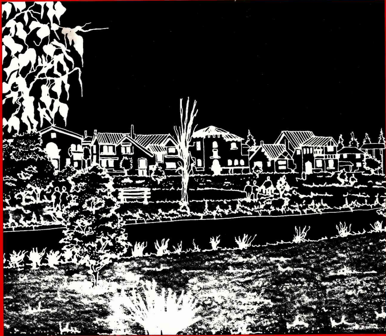
Ilustración: Arq. Miguel Payán

PRODUCTO DE LAS INVESTIGACIONES REALIZADAS POR LOS DOCENTES